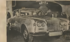
ROLLS ROYCE NOBO Parie Aki nos ta welta e Rolls Royce Silver Shadow.